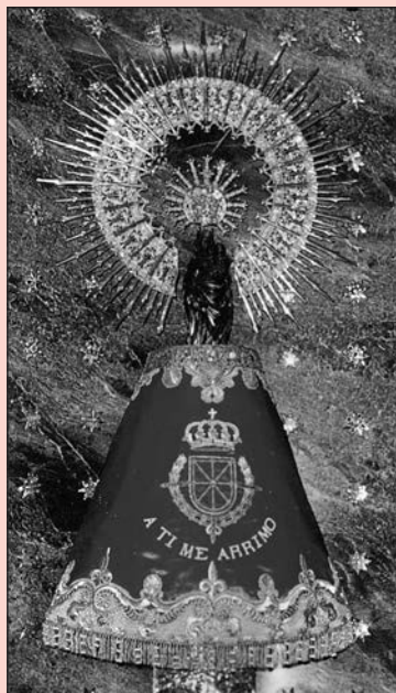
¡Bendita y alabada sea la hora...!

Ángel Custodio de España, tan olvidado. A ti acudimos en estos tiempos difíciles. Dios te ha encomendado la misión de ser nuestro Protector y Defensor en el peligro. Te imploramos para que nos guíes en medio de las tinieblas de los errores humanos y seas nuestro escudo protector ante los enemigos exteriores e interiores de nuestra Patria, alcancemos la reconquista de la Unidad Católica de España y podamos ver la restauración del Reinado Social del Sagrado Corazón de Jesús, y de esta forma España vuelva a ser el paladín de la Fe Católica. Ángel Custodio de España: