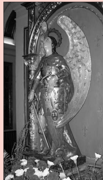
¡A ti acudimos...!

Del olvido de Dios, libranos. De las guerras, libranos. De todo mal, libranos. Ayúdanos, protégenos y sálvanos.